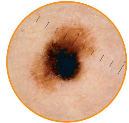
Schwarzer Hautkrebs im Frühstadium unter dem Dermatoskop