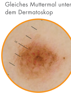
Gleiches Muttermal unter dem Dermatoskop