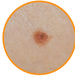
Normales Muttermal: Beurteilung mit bloßem Auge